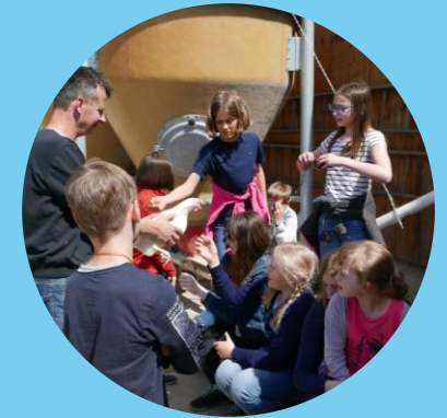
Exkursionen, Fahrten, Arbeitsgemeinschaften