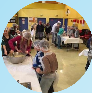
Sprachen & Austausch